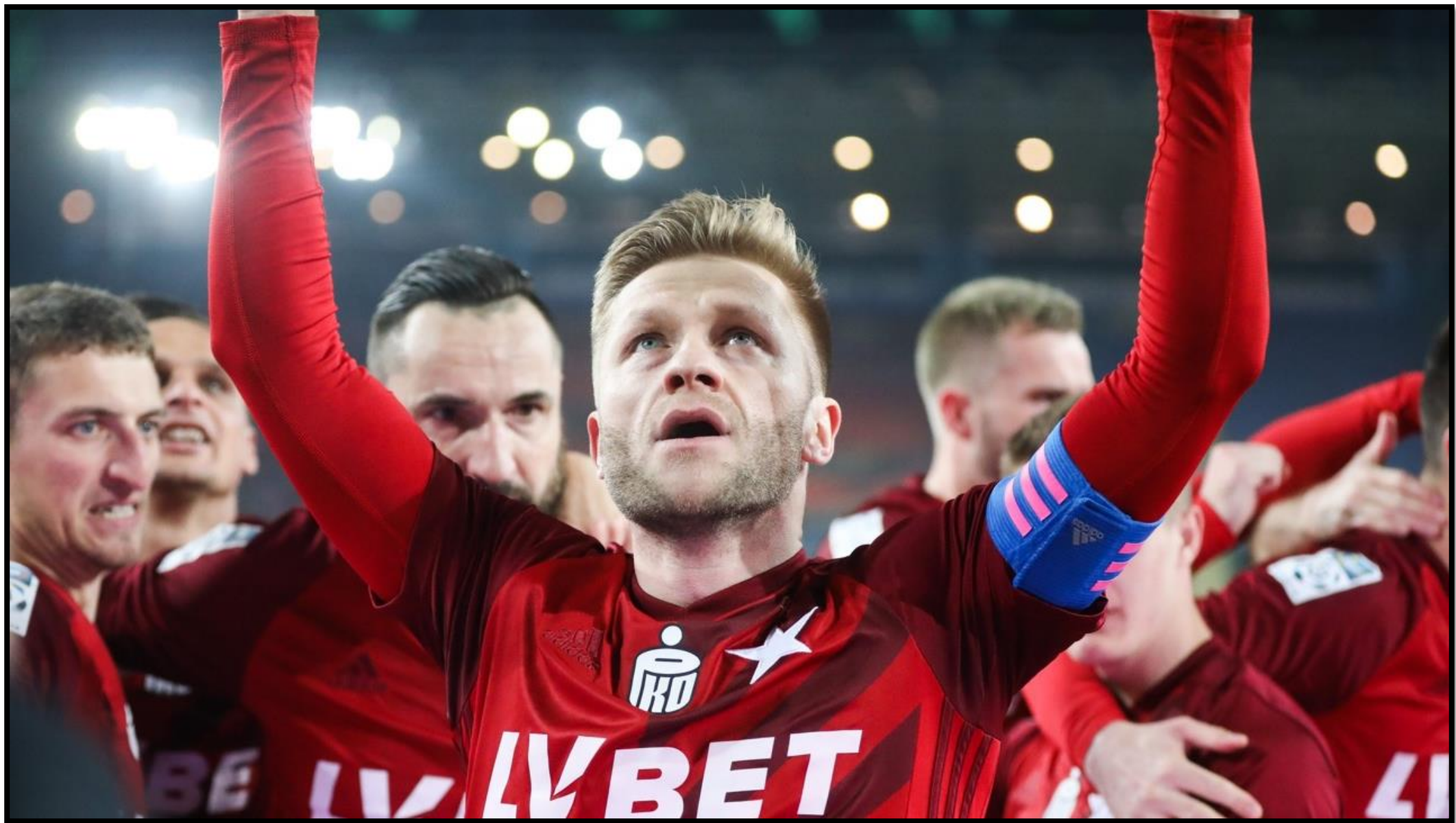
🏆 Jakub Błaszczykowski 🏆