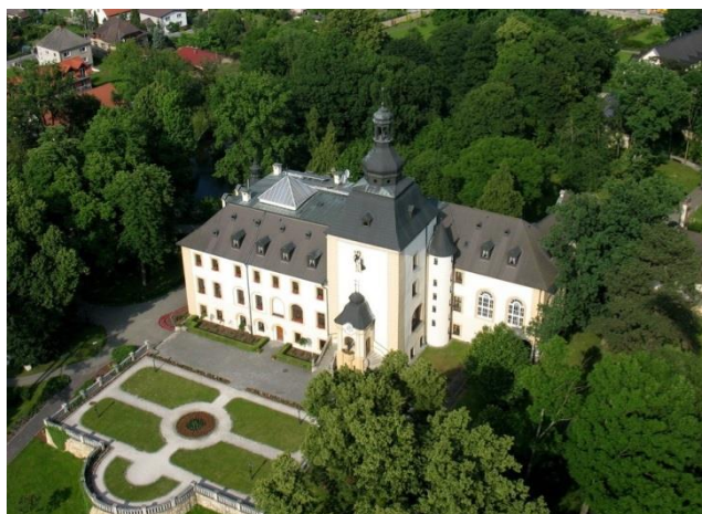
Pałac w Kamieniu Śl. po odbudowie.