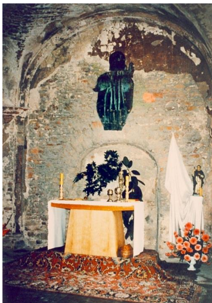
Spalona kaplica. Fot. Archiwum Sanktuarium św. Jacka.

Niestety, gdy pod koniec II wojny światowej (styczeń 1945) do Kamienia Śląskiego wkroczyły wojska sowieckie, wówczas kaplica została spalona, kosztowności zrabowane, a w pałacu urządzono szpital wojskowy. W marcu 1945 roku, po powrocie z wygnania, mieszkańcy Kamienia Śląskiego zastali w obrębie zabudowań pałacowych wielkie spustoszenie. Pałac wprawdzie się ostał, ale został splądrowany, a kaplica wypalona. Przepadły na zawsze cenne zabytki i pamiątki kultu św. Jacka. Po II wojnie światowej pałac przeszedł pod zarząd państwa polskiego. Utworzono w nim dom dziecka. Gdy w latach 50. XX wieku w Kamieniu Śląskim rozbudowano pobliskie lotnisko położone za murami posiadłości, wówczas pałac przeznaczono na potrzeby wojsk sowieckich stacjonujących na lotnisku.