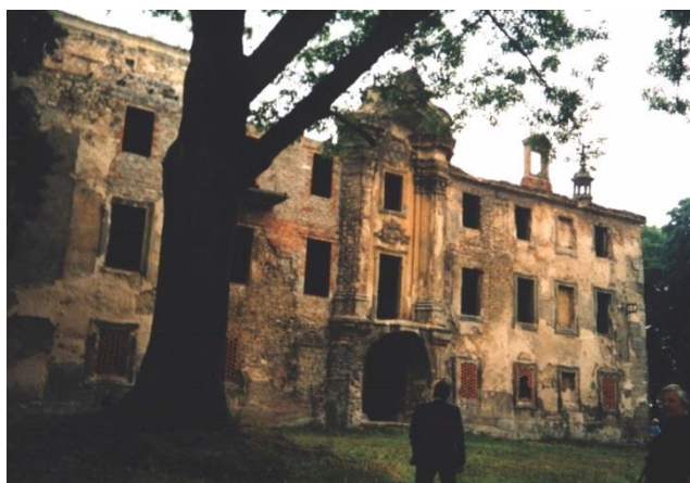
Ruiny zamku w Kamieniu Śl.

Ten okres należy chyba do najtragiczniejszych w dziejach kamieńskiego pałacu. Sowieci splądrowali i rozszabrowali wszystko co tylko miało jakąkolwiek wartość, a w maju 1970 roku pałac podpalamo. Spłonęły wówczas resztki jego wyposażenia. Poważnie zostały uszkodzone także dach i mury pałacu. W ciągu następných dwudziestu lat zrabowano wszystko to, co pozostało.