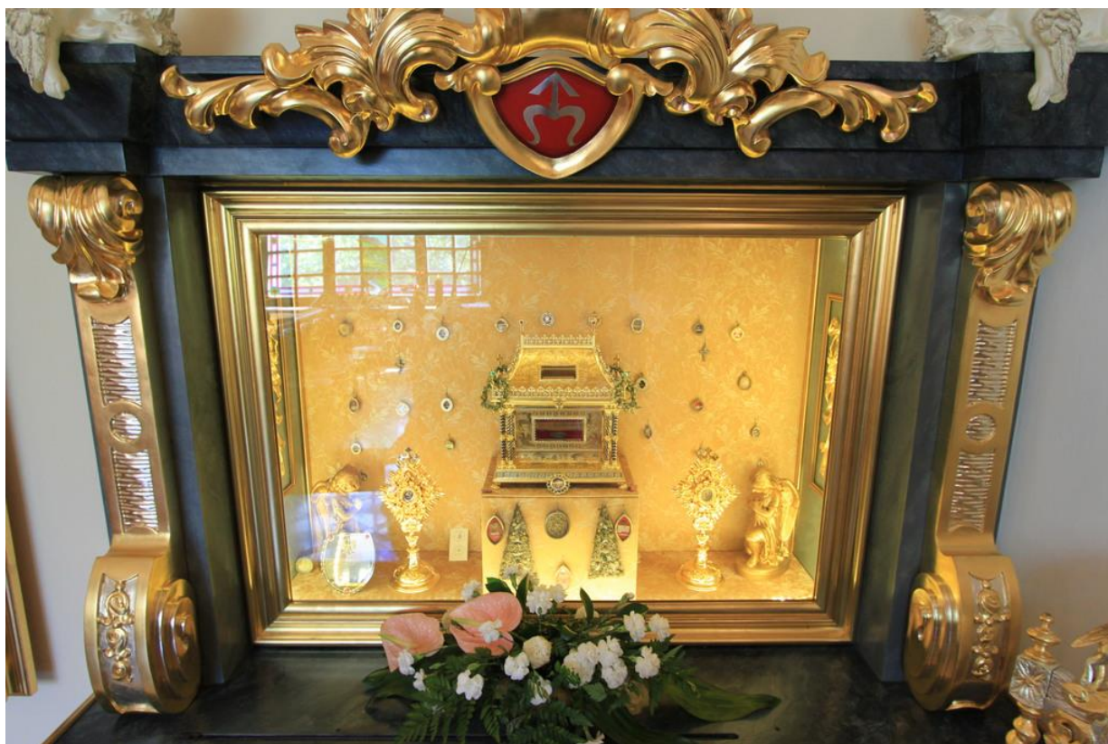
Relikwiarium, w którym znajdują się relikwie św. Jacka, bł. Bronisławy i bł. Czesława.

liczne krajowe i międzynarodowe konferencje i sympozja dla różnych grup społecznych. Jest to miejsce spotkań środowisk akademickich z całego świata. Sanktuarium św. Jacka przyciąga licznych pielgrzymów i turystów, przybywających na chwilę modlitwy oraz pragnących zwiedzić jeden z najpiękniejszych obiektów kultury na Śląsku Opolskim.