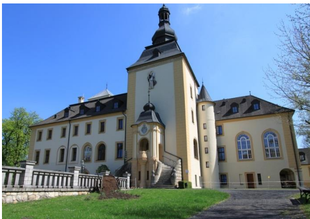
Pałac w Kamieniu Śl. - widok na kaplicę z charakterystyczną wieżą.

W latach 2011-2012, dzięki staraniom ks. dr. Alberta Glaesera, odnowiono kolorystykę ścian kaplicy oraz wyposażono ją w obrazy nawiązujące do pierwotnego wystroju.