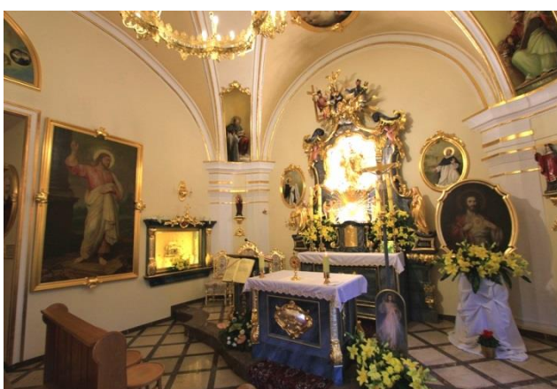
Zdj. z lewej: Obecny wygląd kaplicy św. Jacka. Zdj. z prawej: Wnętrze kaplicy z podświetlanym relikwiarium.

Kaplica wraz z całym kompleksem pałacowym stała się znaczącym sanktuarium i miejscem pielgrzymkowym Górnego Śląska oraz ośrodkiem krzewienia kultury i miejscem pojednania między Kościołami, narodami i kulturami. Dziś pałac w Kamieniu Śląskim określić możemy mianem centrum integracji na szczeblu europejskim i światowym. Organizowane są tu